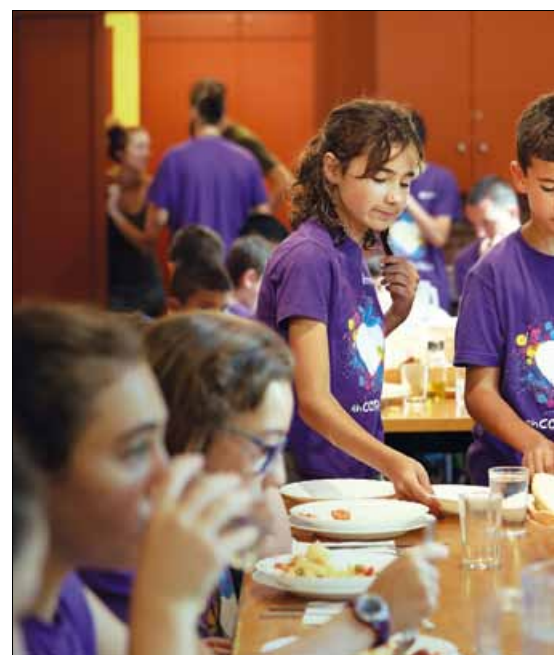
Encoratja't. A l'estiu es continua amb la proposta de violència zero.