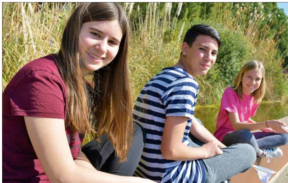
Joves. Campaments, camps de treball i rutes, la principal oferta pels joves aquest estiu.

El caràcter educatiu és un altre dels elements diferenciadors de les activitats d'estiu de Fundesplai. Totes tenen cada any un fil conductor, una proposta educativa, que cada any se centra en un àmbit diferent. Aquest 2019 és "Encoratja't", per la igualtat de gènere i la violència zero, i que han estat