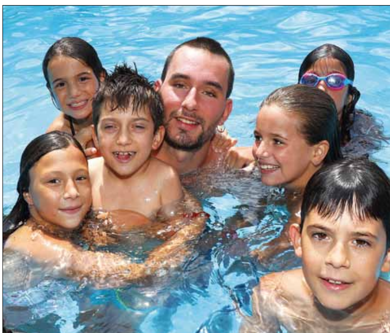
Un estiu refrescant. Totes les activitats d'estiu inclouen activitats i jocs d'aigua i bona part, piscina.

La segona és un casal per a joves de 12 a 16 anys a l'Institut Josep Pla, també de Barcelona, una proposta lúdica originalment pensada per a infants però adaptada en aquest format per a joves. Del 25 de juny al 12 de juliol, els i les joves podran iniciar-se en el món de l'animació i l'stop-motion, participar en geocercues (gimcanes que fan servir la geolocalització dels mòbils), fer rutes urbanes i també excursions a la platja i la piscina.