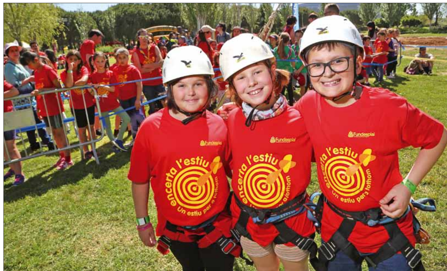
Tot a punt. Fundesplai i els esplais que en formen part ja tenen preparades totes les activitats d'estiu perquè infants i joves gaudeixin al màxim de les vacances.