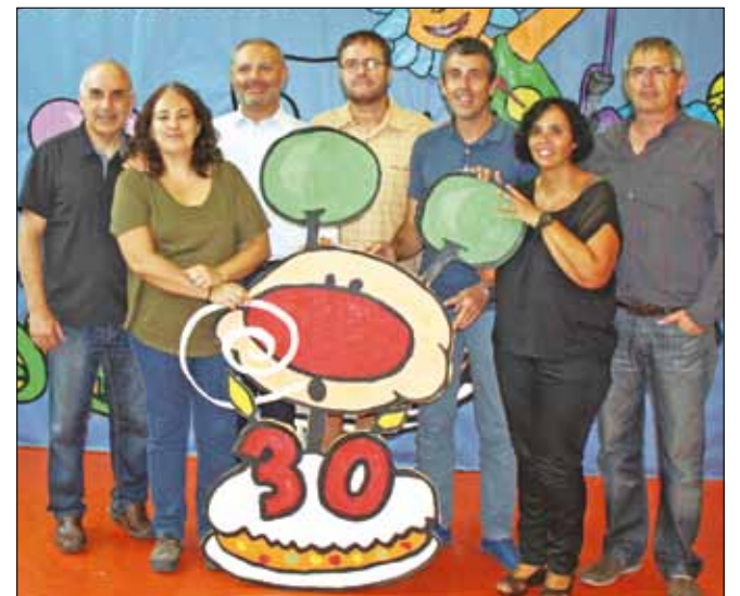
Generacions. Tots els directors/es que ha tingut i té el CE Tricicle