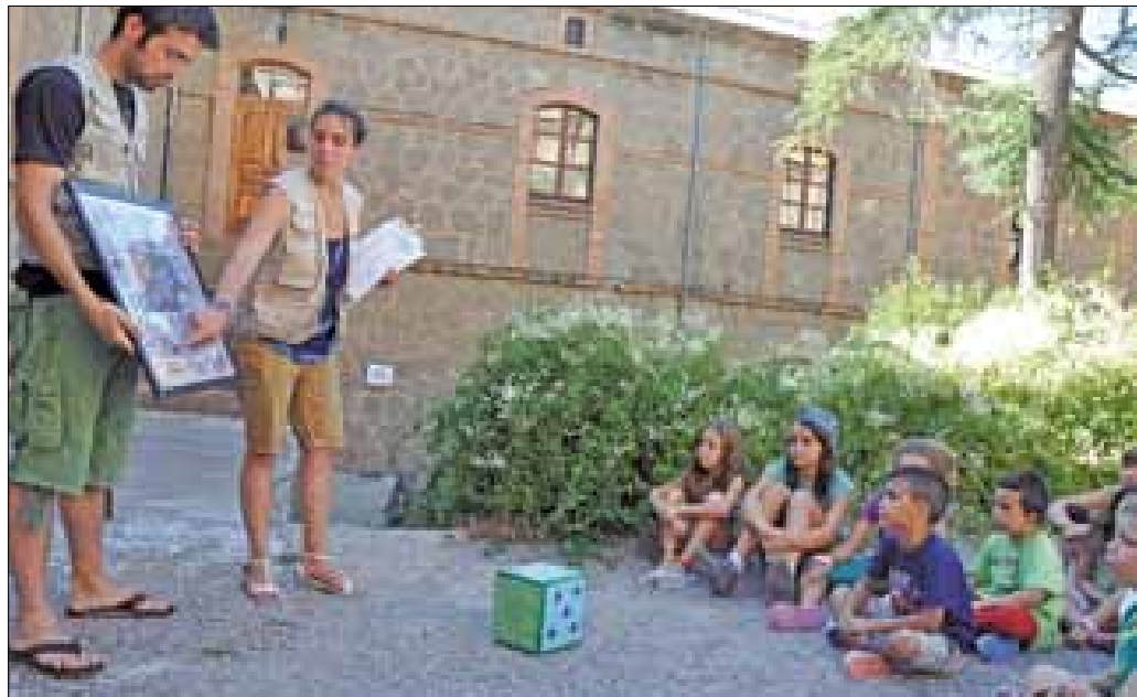
Adaptació. Monitores i monitors organitzen les activitats segons les particularitats de cada grup