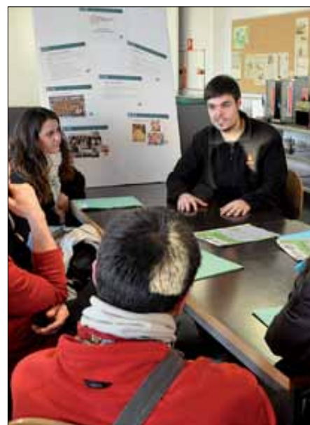
"Talking corner". Es van presentar 13 projectes.

Les Jornades van incloure, entre d'altres, el "Talking corner", un espai on es van presentar fins a 13 projectes innovadors a favor de la infància i la joventut; la dinàmica "Qui som, què fem" o la Diada de Tècniques. Igualment, diumenge es va celebrar l'Assemblea General Ordinària, en la qual es va donar la benvingu-