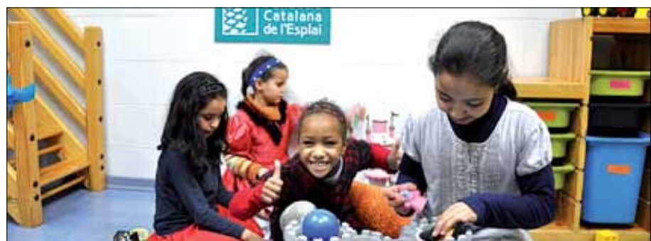
Nova Ludoteca. Infants jugant al CE El Tricicle.