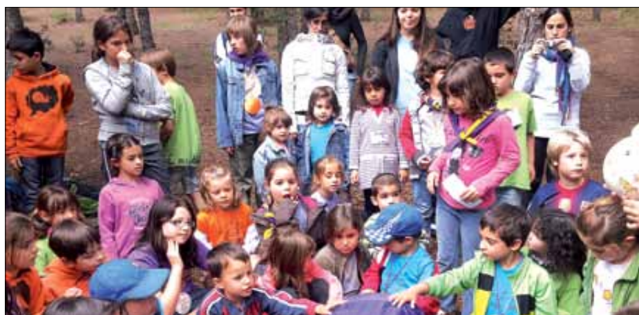
Trobada de l'Anoia - Alt Penedès. El dissabte 18 de maig es va realitzar la Trobada col·lectiva d'aquesta Unitat Territorial de la Federació Catalana de l'Esplai, amb més de 100 participants dels esplais Trapella, Endinsa't i Els Cargols.