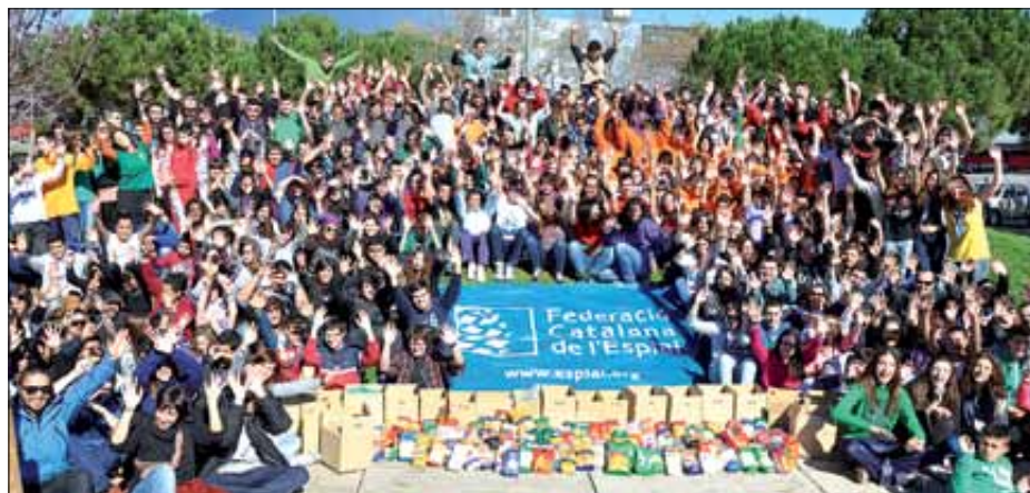
Ral·li Jove. Més de 300 adolescents, el 13 d'abril a Sant Andreu de la Barca.

zar la Marxa de Mitjans a la muntanya de Sant Ramon (Sant Boi de Llobregat), amb 180 infants i 45 monitors i monitores. Aquesta activitat, a més de fomentar l'excursionisme i la descoberta de la natura, va abordar el treball vers els projectes d'aprenentatge i servei (ApS), a través d'una acció de plantació d'arbres i arbusts a la muntanya. A més de les activitats per edats, també han tingut lloc trobades col·lectives en l'àmbit territorial, com les desenvolupades al Tarragonès, a l'Alt Penedès i Anoia, i al Maresme.